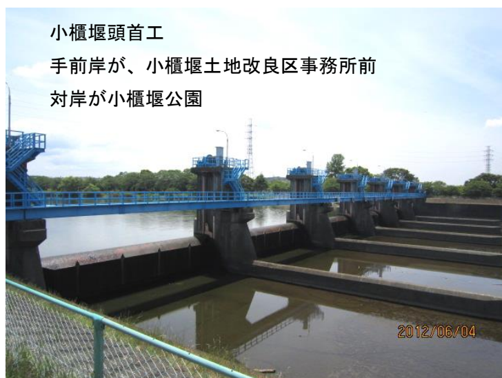
小櫃堰頭首工 手前岸が、小櫃堰土地改良区事務所前 対岸が小櫃堰公園